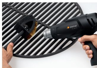
Nettoyer la grille du barbecue