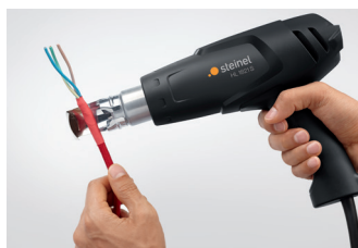
Sertir des gaines