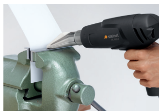
Façonner du plastique