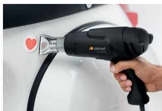
Décoller des étiquettes