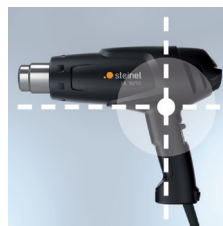
Centre de gravité de l'appareil optimisé