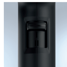
Soufflerie à 2 vitesses