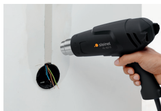
Sécher un enduit