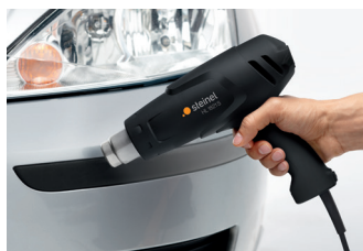
Remettre du plastique à neuf